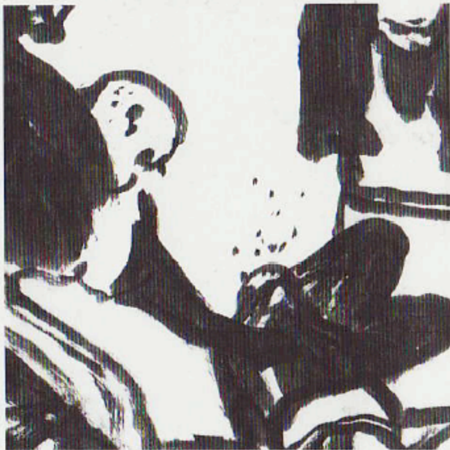
4 tavole 29,5x21 cm china

Tutti possono agire in giudizio per la tutela dei propri diritti e interessi legittimi. La difesa è diritto inviolabile in ogni stato e grado del procedimento. Sono assicurati ai non abbienti, con appositi istituti, i mezzi per agire e difendersi davanti ad ogni giurisdizione. La legge determina le condizioni e i modi per la riparazione degli errori giudiziari.